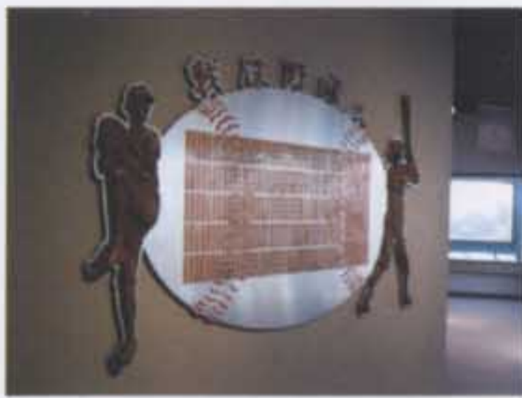
アマチュアコーナーに設置されたモニュメント