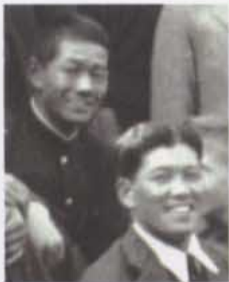
沢村栄治氏 (手前は水原 茂氏)